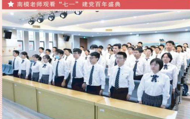
★ 南模学生观看“七一”建党百年盛典