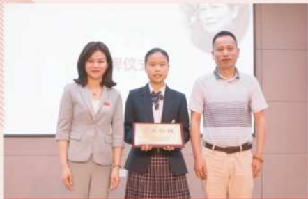
● 2023届二班“宋庆龄班”授牌仪式