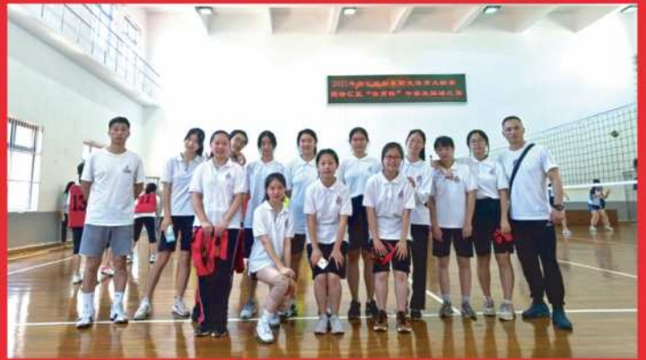
南模女排获区“位育杯”排球三等奖