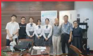
第十八届全国中学生水科技发明创新一、二等奖的获奖团队