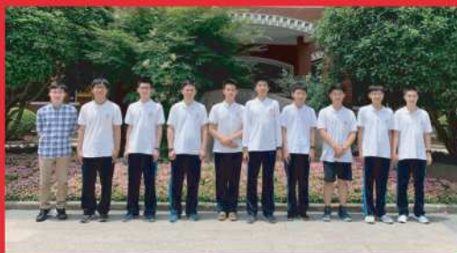
2021年市数学竞赛获奖学生