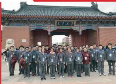
参加交大“钱学森挑战计划”学术项目的学生