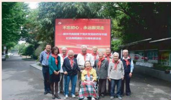
★ 原中共地下党成员与校领导合影