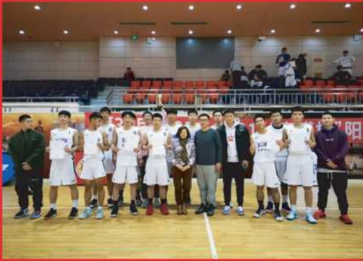
南模荣获2020年上海市中小学生篮球冠军赛冠军