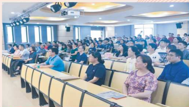
★ 南模老师观看“七一”建党百年盛典