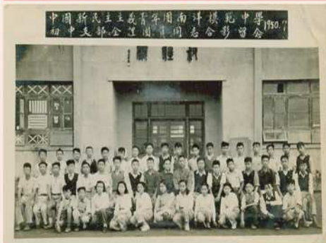
● 1950年南模的新民主主义青年团初中支部合影