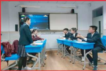
荣获区第十三届“西南位育”高中英语辩论邀请赛团体一等奖