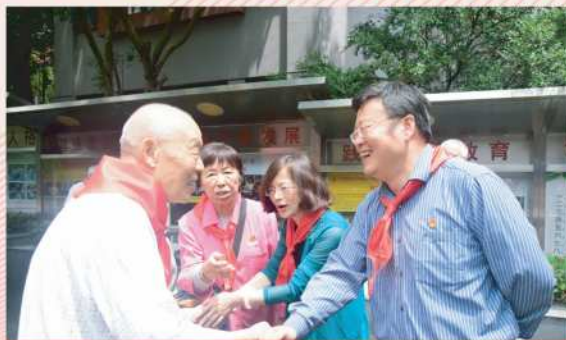
★ 校长、书记欢迎老校友