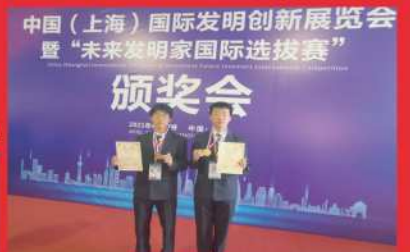
中国（上海）国际发明创新展览会暨“未来发明家国际选拔赛”金奖、银奖获奖者