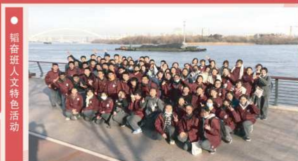
● 韬奋班人文特色活动