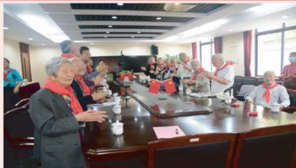
★ 高唱“没有共产党就没有新中国”