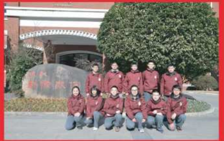
参加“2020年上海市中学生古诗大会”的获奖同学