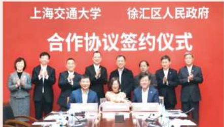
● 南模教育集团与交大签署合作协议