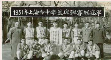
● 1951年南模获上海市中学生篮球联赛冠军