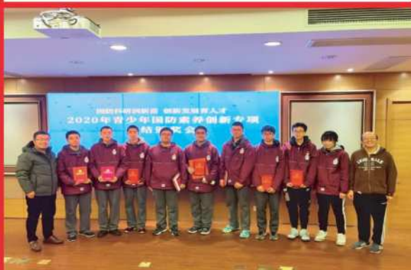
青少年国防素养创新专项活动获奖团队