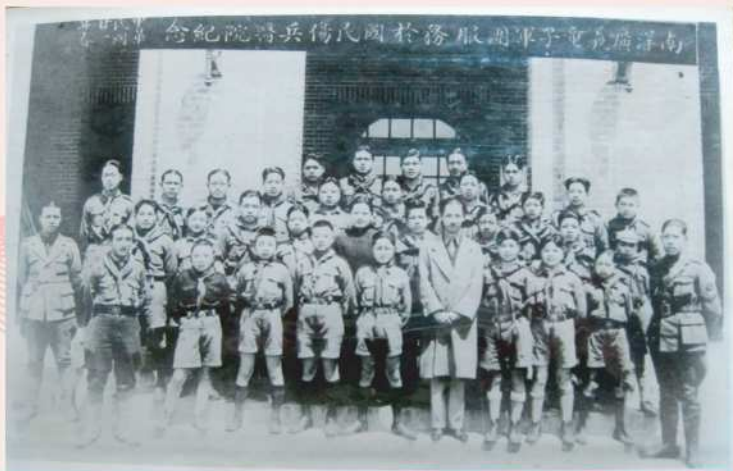
● 抗战时期宋庆龄与南模学生合影