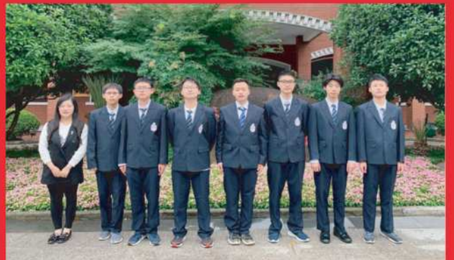
市第26届高一物理基础知识竞赛中获奖同学