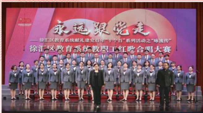
★ 南模中学教工合唱团参加“迎接建党百年红歌赛”