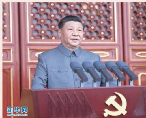
★ 建党百年盛典上习主席讲话